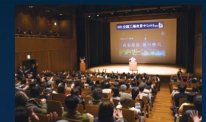
2020年2月8日開催「第10回 全国工場夜景サミット in 堺・高石」の様子

<表紙の写真:富士市の工場夜景> 第10回 全国工場夜景サミット in 堺・高石「フォトコンテスト」最優秀賞受賞作品