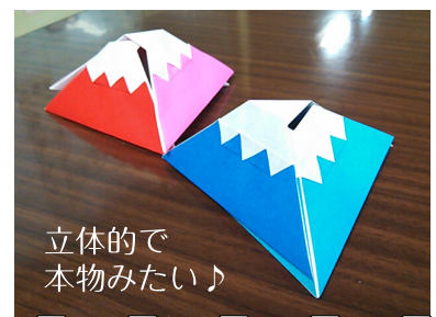
立体的で 本物みたい♪