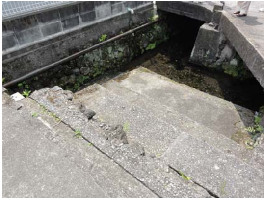
③ 長学寺前 (湧水源)