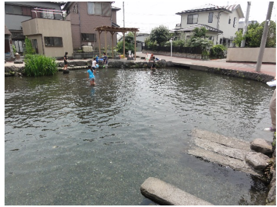
② 丸池 (湧水源)