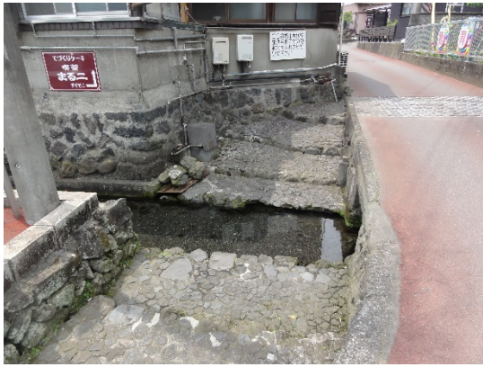
① 医王寺前 (湧水源)