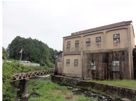
斉藤橋から見えるレトロな建物