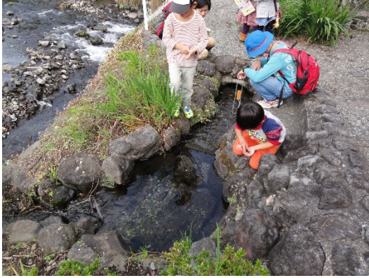
鎧ヶ淵親水公園（湧水源）