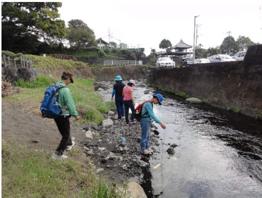
親水護岸での自然観察の様子