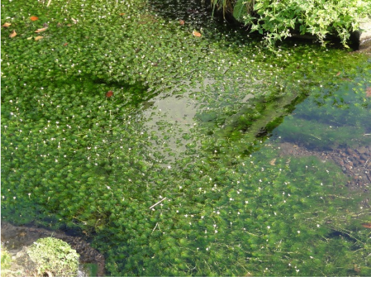
バイカモの開花の様子