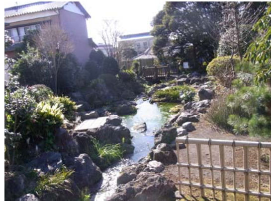
②原田湧水池公園（湧水源）