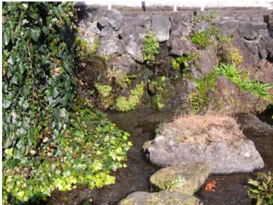
① 原田湧水池公園・北（湧水源）