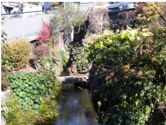
③ 原田湧水池公園・東（湧水源）