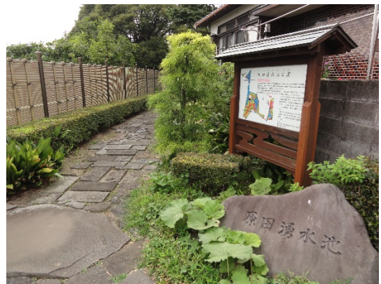
公園東側の入り口