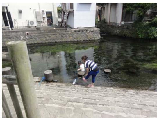
親水護岸で水遊びをする親子