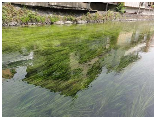
清流に揺れる梅花藻