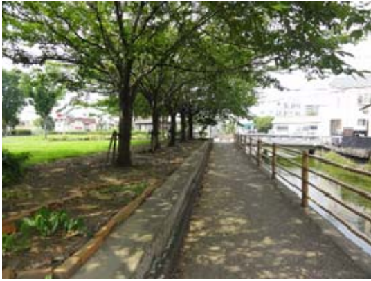
田宿川沿いの遊歩道と公園