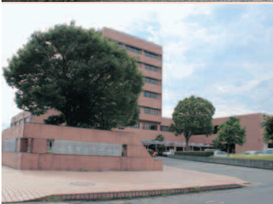
※旧中央病院は、現在の県富士総合庁舎の場所にあった。