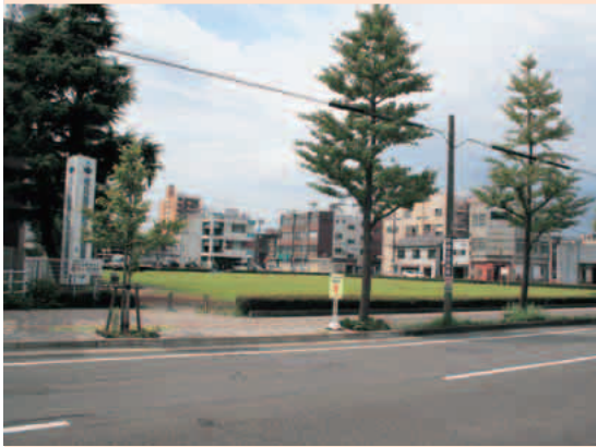
※平成6年に吉原市民ひろばとして整備された。