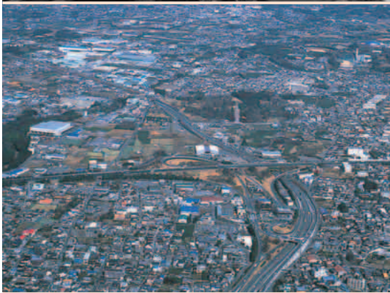
東名高速道路富士IC