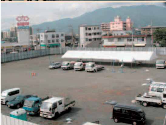
富士文化センター

※富士文化センター（平成6年に富士市民センターに改名）は平成16年に閉館した。 現在、(仮称)富士交流プラザの建設工事が始まった。