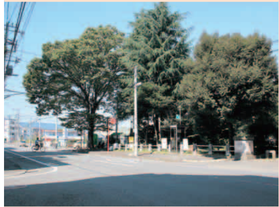
※現在の平垣公園付近。