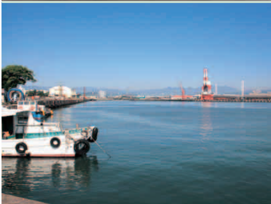
田子の浦港の再生