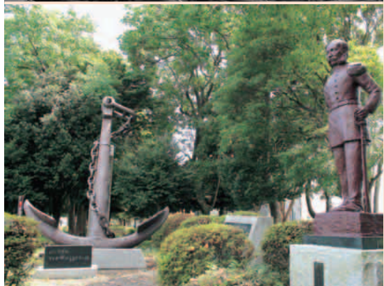
ディアナ号の錨 いかり