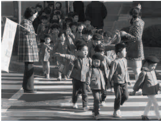
幼稚園児の通園風景