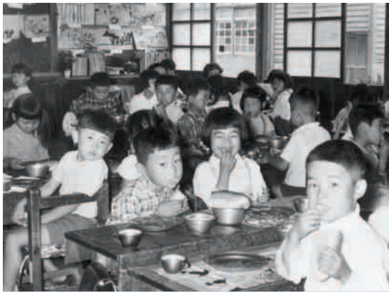
小学校の給食風景