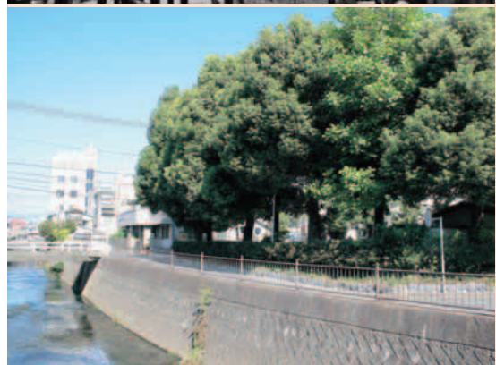
※現在の天神社北側付近（今泉1）。