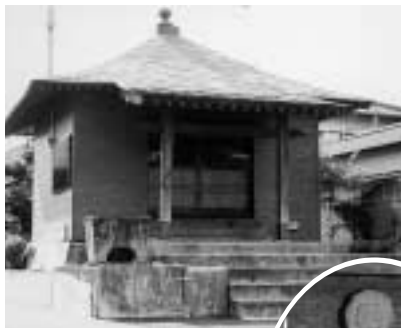
お堂と砂山の お地藏さん