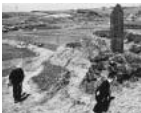
◀ 昭和二十年代の源太坂

しかし、高台には段々畑や梅林が広がり、北には富士山、坂の下は広く開けた平野で、とても眺めのよいところでしたよ。