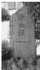
▲ 現在(平成12年)の石碑(右)とその付近の様子