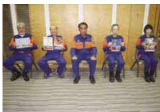
富士市消防団員募集チラシコンテスト