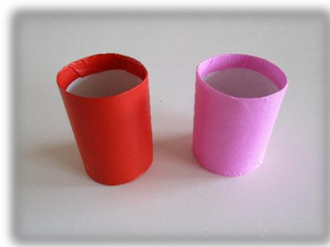
④ 芯からはみ出た部分の折り紙は、内側に織り込む