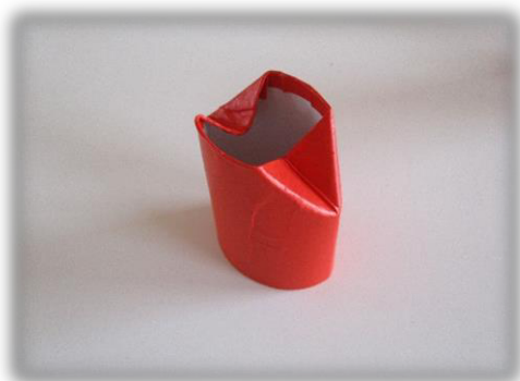
⑤ ひっくり返して、角を内側につぶす