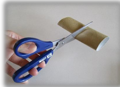
② トイレtpペーパーの芯を半分に切る