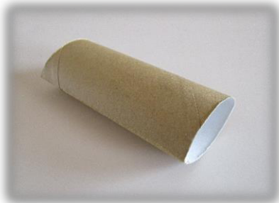
① トイレtpペーパーの芯を軽くつぶす