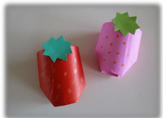
⑥ へたを付けたら、つぶつぶを描いたりする