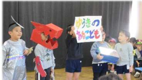
友達と一緒に役にになり切り、自分なりの表現を思い切り楽しめます。