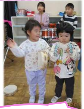
いろいろな楽器に触れ音やリズムを表現します。