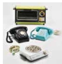
春のテーマ展から 「昭和の家電の数々」

※イベント等を変更・中止する場合があります。最新情報はウェブサイトなどをご確認ください。