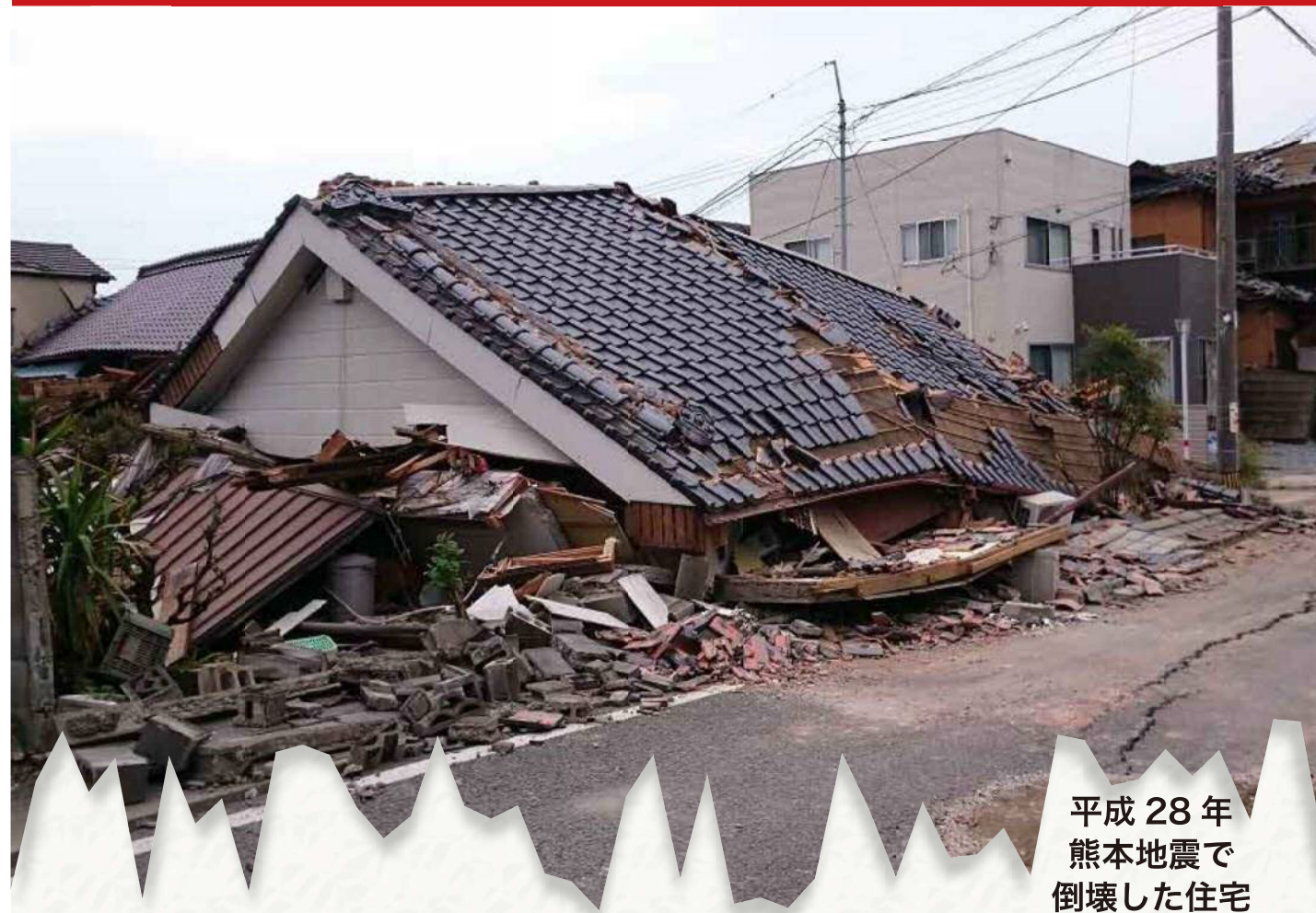
平成28年熊本地震で倒壊した住宅