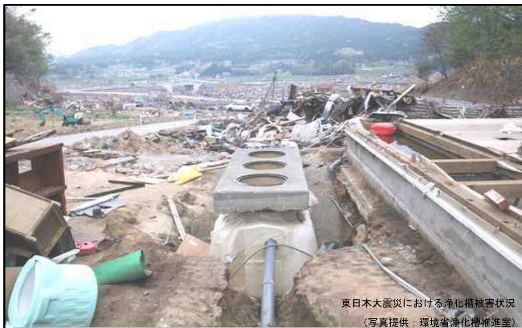
東日本大震災における浄化槽被害状況