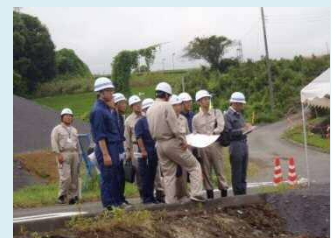
ごみ処理施設建設特別委員会による現地確認

工事の状況だけでなく、環境監視(大気、騒音、振動)を行っていくことを説明し、測定地点の状況も確認してもらいました。