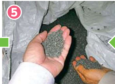
5 プラスチックの原料に成形