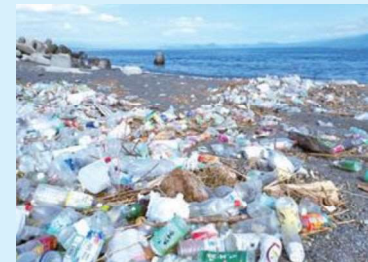
市内の海岸に打ち上げられたごみ（令和元年度撮影）