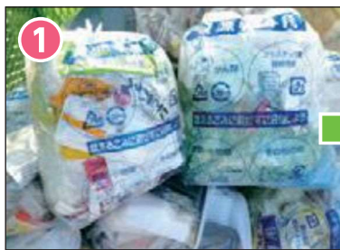
1 回収し、選別工場へ運ぶ