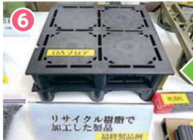
6 プラスチック製品にする