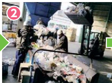
2 袋を開け、手作業で異物を除去