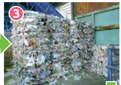
3 圧縮してリサイクル工場へ