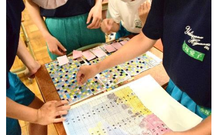
隣接部分は色味調整が必要です