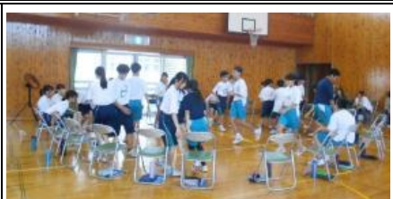
1年⑤「なんでもバスケット」