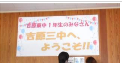
校内の心温まる掲示物

放課後には、部活動の見学及び体験入部、合同練習などを行い、一緒に汗を流しました。