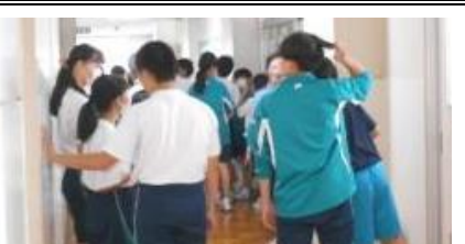
2年⑤「校内ウォークラリー」