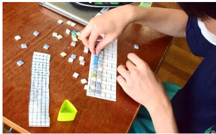
設計図を基に個人作業に集中

この活動には、国際ソロプチミスト富士の皆さんが寄附金を提供してくださっています。作成当日は会員の方々や教育長も制作活動に参加し、生徒と一緒に作成に取り組みました。