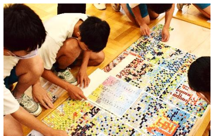
全体のバランスを見て再調整