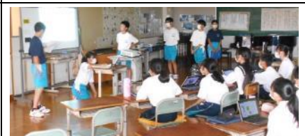
1年⑥「行事及びSDGs 報告会」