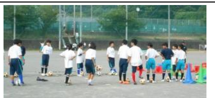
放課後には部活動も合同で実施