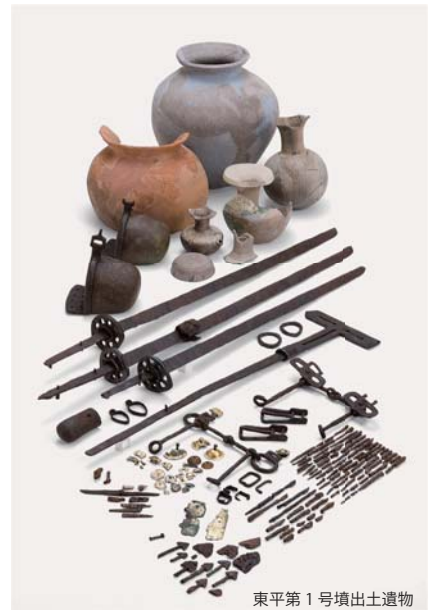
東平第1号墳出土遺物

平成30（2018）年3月刊行 [税込定価] 2,400円 [送料] 360円 A4判 本文125頁・巻頭カラー図版1頁・カラー写真図版29頁