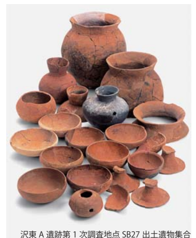
沢東A遺跡第1次調査地点SB27出土遺物集合

平成26 (2014) 年3月刊行 [税込定価] 2,600円 [送料] 360円 A4判 本文95頁・巻頭カラー図版8頁・モノクロ写真図版34頁