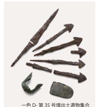
一色D-第35号墳出土遺物集合

平成31 (2019) 年3月刊行 [税込定価] 2,200円 [送料] 360円 A4判 本文166頁・カラー写真図版22頁