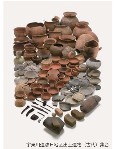
宇東川遺跡F地区出土遺物(古代)集合

令和3 (2021) 年3月刊行 [税込定価] 3,400円 [送料] 着払いまたはレターパックライト (封筒を送付願います) A4判 本文186頁・巻頭カラー図版2頁・カラー写真図版62頁