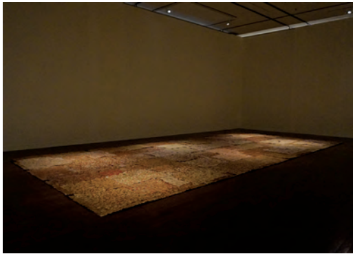
『Self』2019年 - 2022年