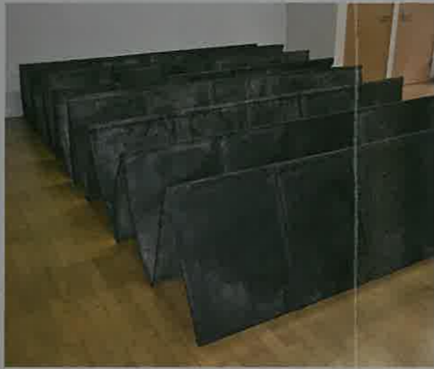
「平和の風」土佐権手書き和紙、越前紙、墨 2017年