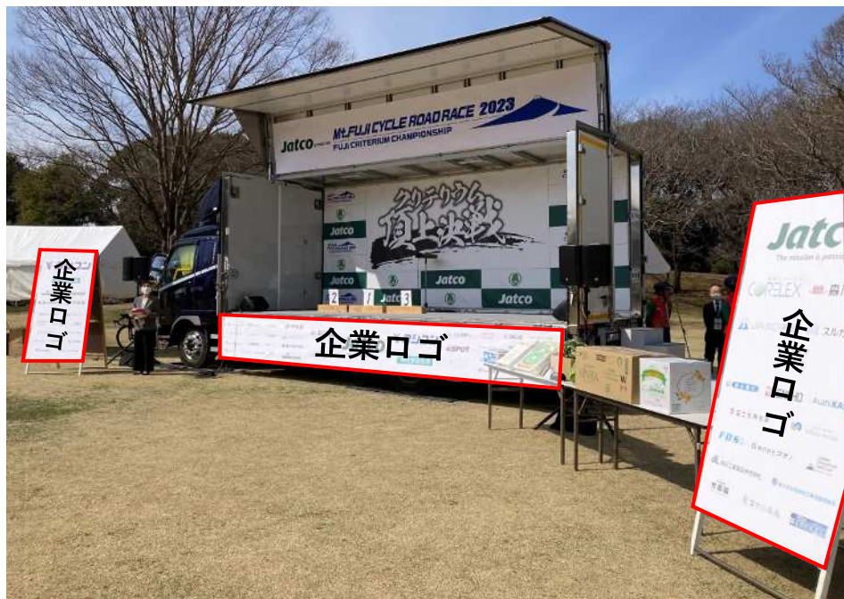
※写真は過去大会のものです