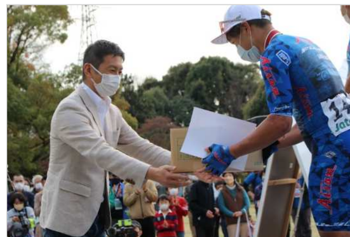
※写真は過去大会のものです