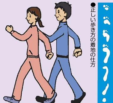
かかとから着地し、つま先で着く。この間は約1秒。(1分間に約70m)