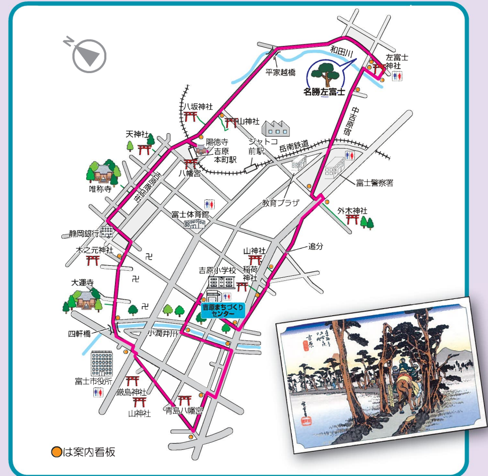
●【吉原】旧東海道吉原宿コース 全長約6km