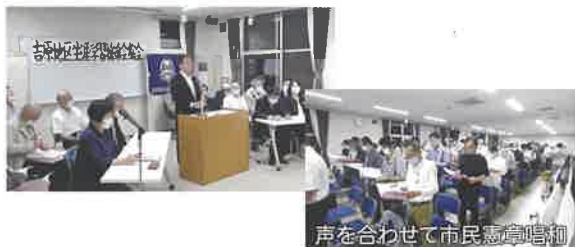
声を合わせて市民会堂合唱

様々なイベントを企画しますので、ぜひ参加して地域の方々との交流を進めましょう。それが有事の時に必ず役立つと信じています。