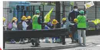
交通ルールやマナーをしっかり守ろうね!

交通安全協会吉原分会では、新1年生の下校時刻に合わせて通学路で交通指導を行いました。横断歩道の渡り方や信号機の見方、飛び出しをしないことなど交通ルールやマナーを丁寧に指導し、交通安全を呼び掛けました。特に横断歩道では「右、左、右」としっかり確認し、手を挙げて渡ることを繰り返し指導しました。