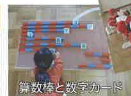
算数棒と数字カード