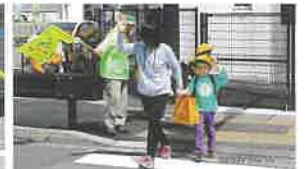
よく見て、手を挙げて渡ります。

新1年生だけではなく子どもたちが安全に登下校できるよう、これからも交通安全の呼びかけを続けていきます。