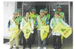
交通安全協会吉原分会の皆さん

新1年生だけではなく子どもたちが安全に登下校できるよう、これからも交通安全の呼びかけを続けていきます。