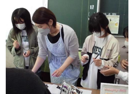
<トータルビューティーHisui様>