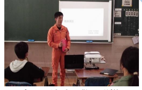
<富士西消防署救助隊様>