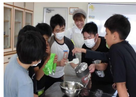
<キャトルエピス様>