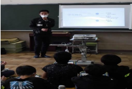
<岳南Fモスペリオ様>