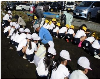
＜スイートポテト作り＞