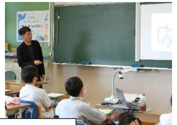
6年職業講話 子どもたちの真剣な眼差しが、たくさん見られました。