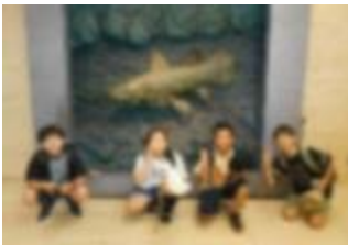
国立科学博物館にて