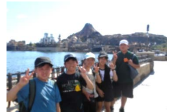
ディズニーランドにて

今回の旅行では、バスガイドさん、運転手さん、旅行をサポートしてくれた添乗員さん、ホテルで働くホテルエさん、ディズニーランドで働くキャストさん、劇団四季の役者さんなど、普段の生活の中ではなかなか出会うことのない人たちに会うことが出来ました。