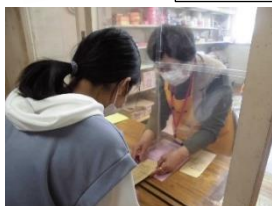
購買ボランティア