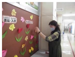
図書ボランティア