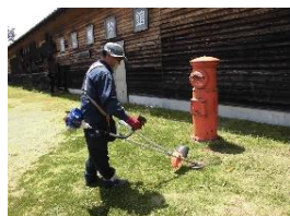
園芸・剪定・草刈ボランティア