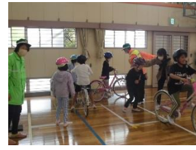
1年生 正しく、安全に歩こう！