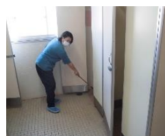
トイレ清掃ボランティア