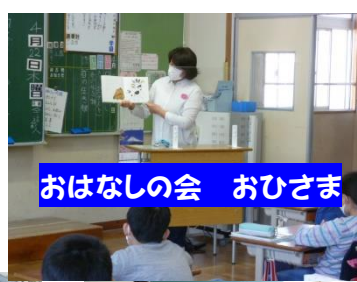
おはなしの会 おひさま