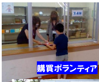
購買ボランティア