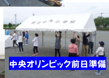
中央オリンピック前日準備

富士中央小の子どもたちに安心と、充実した学びを提供していただき、本当にありがとうございます。