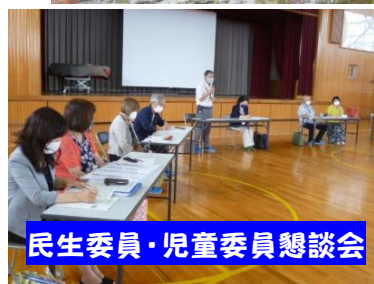
民生委員・児童委員懇談会