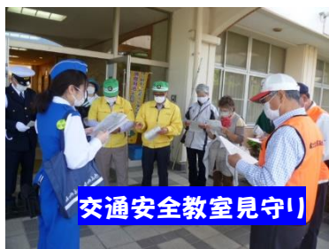
交通安全教室見守り

4月から7月までの地域の皆さんと富士中央小の子どもたちとの活動の一部を紹介します(敬称略)