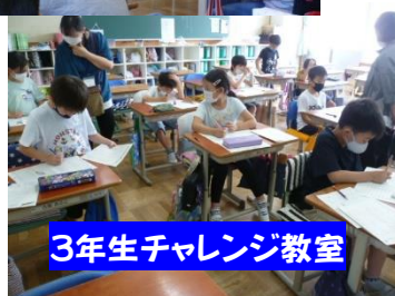
3年生チャレンジ教室