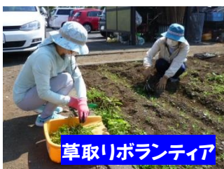
草取りボランティア