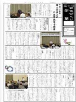
◀ 富士川まちづくり新聞（作文コンクールの受賞作品を掲載しました）

審査は、まちづくり協議会会長、副会長、会計、青少年育成部長、成人教育部長の皆さんが担当しました。各自、全作品を読み込んだ上で最終審査に臨み、じっくりと協議して最優秀賞、優秀賞、入選を選びました。もっとも大切にされた審査基準は、どんな体験をし、そのうえで、どんな夢を思い描いているのか、という点でした。審査を通じて、富士川地区ならではの宝物や可能性をたくさん見つけることができました。今後は、富士川地区まちづくり協議会として、子どもたちの目線で描かれた独創的な未来への提案を、より多くの地区の皆さんで共有し、具体的な活動などの参考にしていきたい、と考えています。