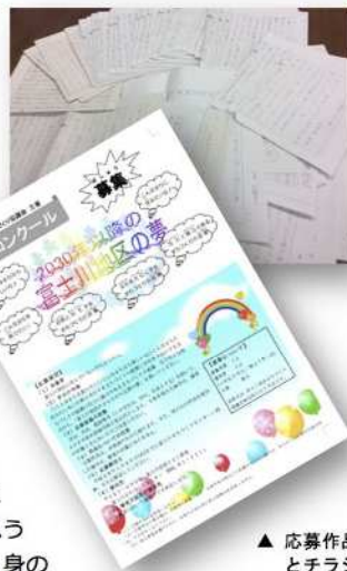
▲ 応募作品とチラシ