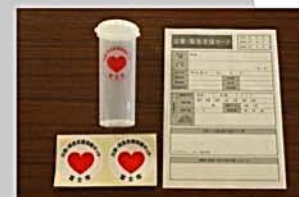
「災害・緊急支援情報キット」

自主防災会では、地区にお住まいの高齢者に「災害・緊急支援情報キット」の登録を呼びかけています。個別に声をかけると、「周囲の迷惑になりたくない」という登録を渋る声も聞かれる一方で、「(登録することで)地区の仲間になれた」と話す人もいたそうです。部会の方々はこのような地道な声かけが地区のつながり、コミュニティづくりにつながることを感じているようです。