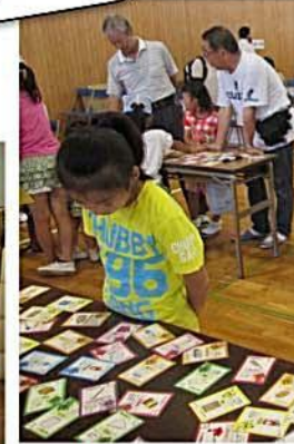
防災カードゲーム『なまずの学校』