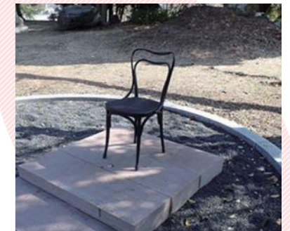
ノーベル賞の椅子 （岳南忠霊廟内）