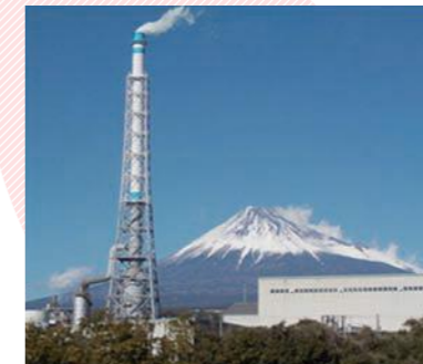
製紙工場と富士山