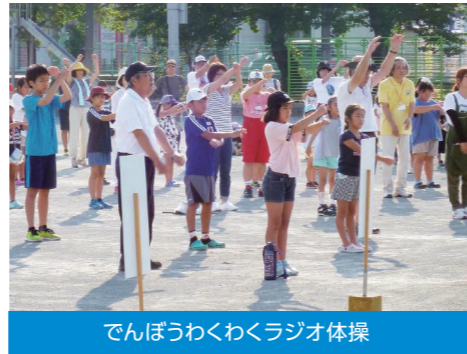
でんぼうわくわくラジオ体操