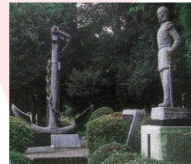
ディアナ号の錨（公園）