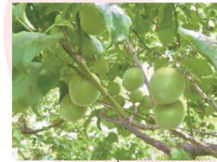
まちづくりセンター 梅の木