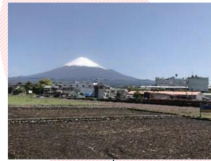
天間小学校 天間っ子田んぼ