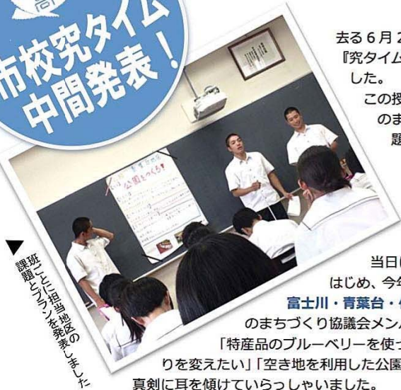
講師(山梨県立大学の先生)と一緒に 「探究タイム」の中間発表!

去る6月24日(金)、富士市立高校2年生による『究タイム・市役所プラン』の中間発表が行われました。