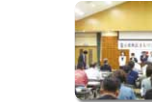
〈まちづくり協議会の総会 (富士北地区)〉