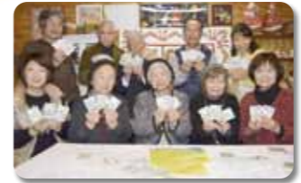
〈歴史かるたの作成 (松野地区)〉