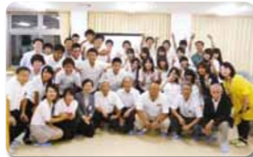
〈高校生と意見交換〉