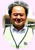
須津小学校 新校長

よく、子どもたちが「ひと・もの・こと」の本物にふれることで、学ぶ意欲や探究心が育まれ、学ぶ楽しさを実感できる子に成長してほしいと願っています。また、子どもたちが地域の方々と関わり、地域の特色あるものにもふれたり、様々な事実を確かめたりすることで、地域のよさを再発見し、自分の地域への愛着も生まれていくと考えます。 将来、須津地区を担っていく子どもたちを、地域と学校が一緒に育てていきたいと思