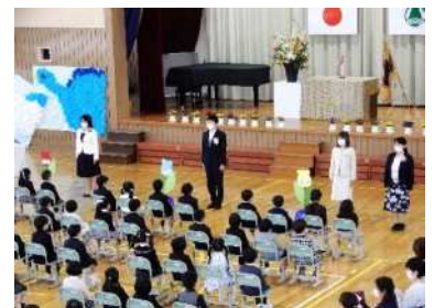
4月7日 須津小学校入学式