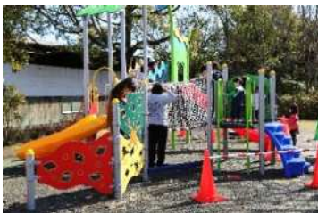
3月14日 江尾公園 新遊具落成式