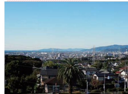
富士見台からの眺望