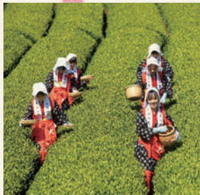
2023 フォトコンテスト 応募作品 huge1091 さま

茶摘みをする茶娘の風景を写真におさめませんか？ 撮影会は開会式終了後から行い、途中休憩をはさみながら行います。 茶娘モデルは地元の小中学生・高校生がメインです。 マナーを守りトラブルのないように撮影をお願いします。