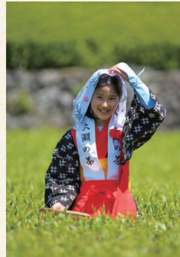
2023 フォトコンテスト 入賞作品 miyakawagram さま