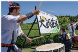
2023 大淵笹場フォトコンテスト 応募作品 kazuunumata さま