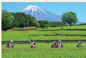
2023 フォトコンテスト 入賞作品 akemi.186 さま