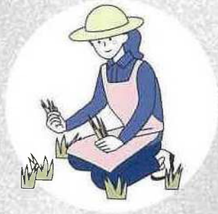
簡易な庭の草取り