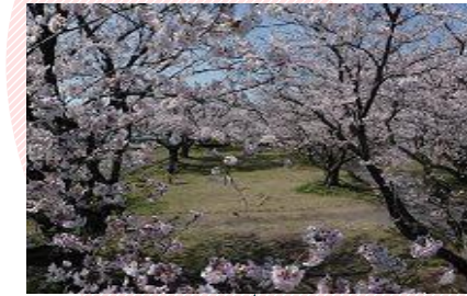
厚原スポーツ公園の桜