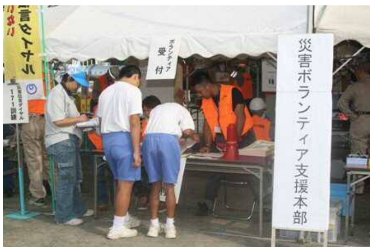
災害ボランティア支援本部開設訓練

市民活動は阪神・淡路大震災の直後、柔軟性・先駆性・専門性・自発性・変革性といった特性を生かした迅速で多彩な活動が評価され、その後、東日本大震災や近年の気候変動による災害が頻発する中、その活動の社会性や協働性はさらに高まり、行政、企業と並ぶ、社会サービスの担い手として、その特性を活かした真に豊かなまちづくりの実現に向けての活動が期待されています。