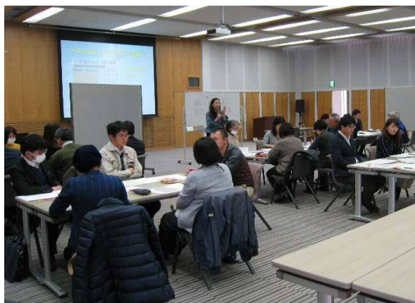
市民団体と行政職員による交流会「きょうどうへのはじまり交流会」（平成30年度）

同じ課題と一緒に取り組むのであれば、見知らぬ同士よりお互いを知っているほうが、スムーズに進みます。まずは互いを知るきっかけとして、市民活動団体と行政職員が顔見知りになる交流の機会を提供します。