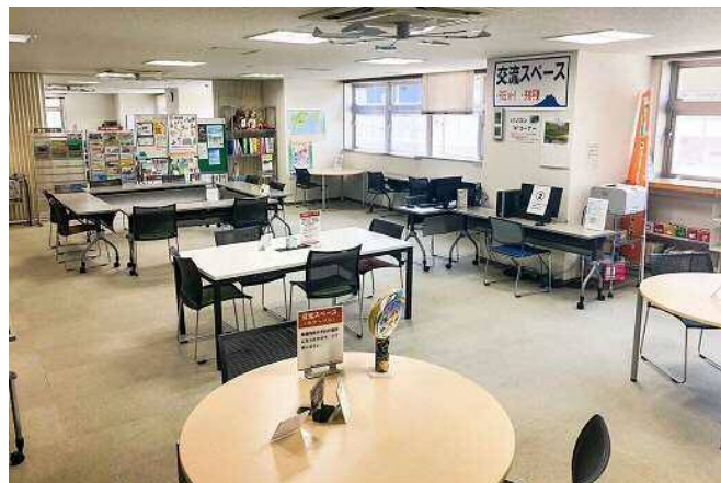
富士市民活動センター (交流スペース)