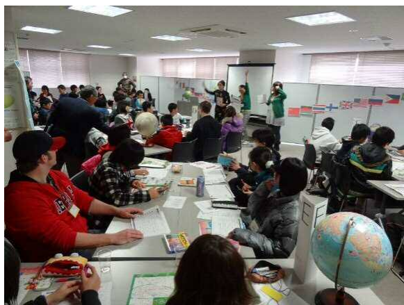
富士市民活動センター (イベントでの利用)