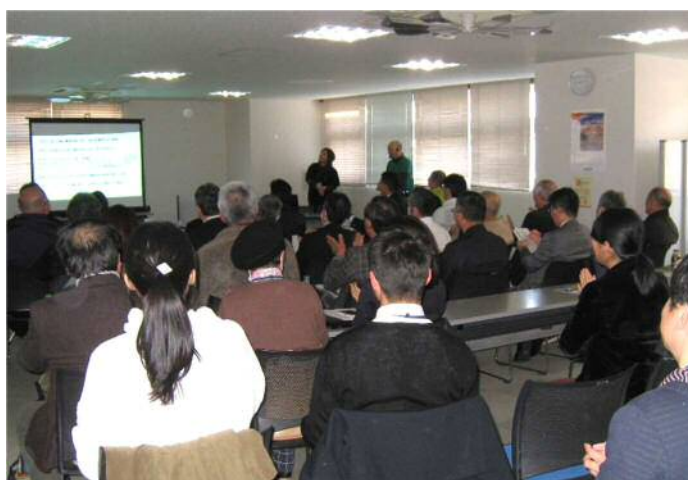
人材育成事業 FUJI 未来塾

市民活動を始めるきっかけとなる講座を継続的に実施するとともに、講座修了生の活動継続に必要な支援を行い、協働の担い手となる人材を育成していきます。