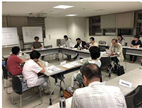
富士市民活動センター (会議スペースの利用)