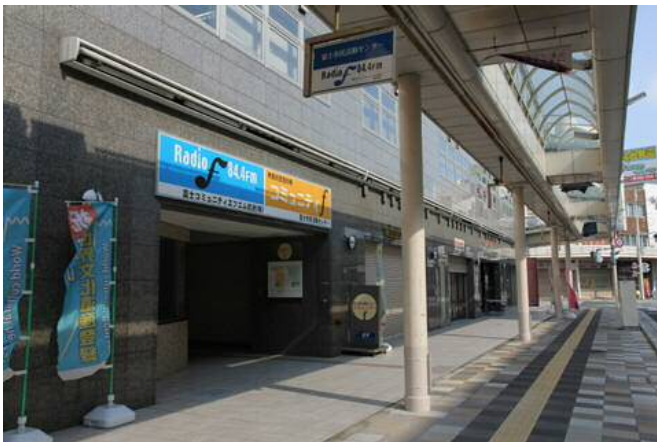
富士市民活動センター コミュニティ f

また、発信する内容によって想定する受け手が変わること、受け手の市民活動とのかかわりの度合いによって必要とする情報が変わることなど内容や相手を意識した情報発信を行っていきます。