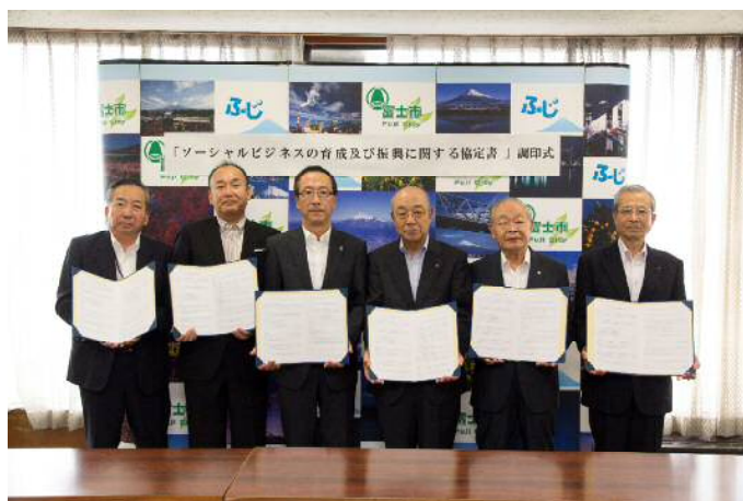
富士市、富士市民活動センター、富士商工会議所、富士市商工会、富士信用金庫、日本政策金融公庫によるふじソーシャルビジネス支援ネットワーク調印式（平成27年）

ソーシャルビジネス(social business)とは、環境・地域活性化・少子高齢化・福祉・生涯教育など社会的課題への取り組みを、継続的な事業活動として進めていくことです。地域の自立的発展、雇用創出につながる活動として有望視されています。