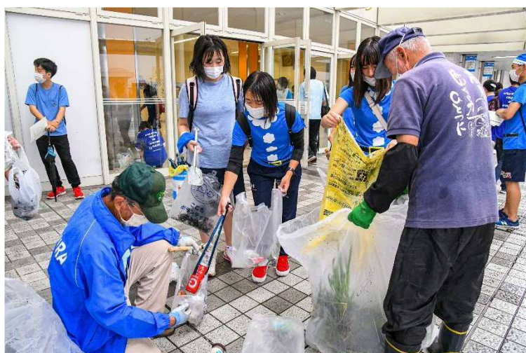
アダプションプログラム事業 「ふじクリーンパートナー」