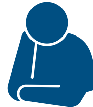
Cảm giác uể oải