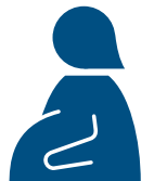
Phụ nữ đang mang thai

● Phụ nữ đang mang thai hoặc người có trẻ nhỏ vui lòng tham khảo trên trang web.