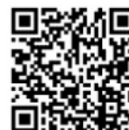
Mã QR của trang web thành phố