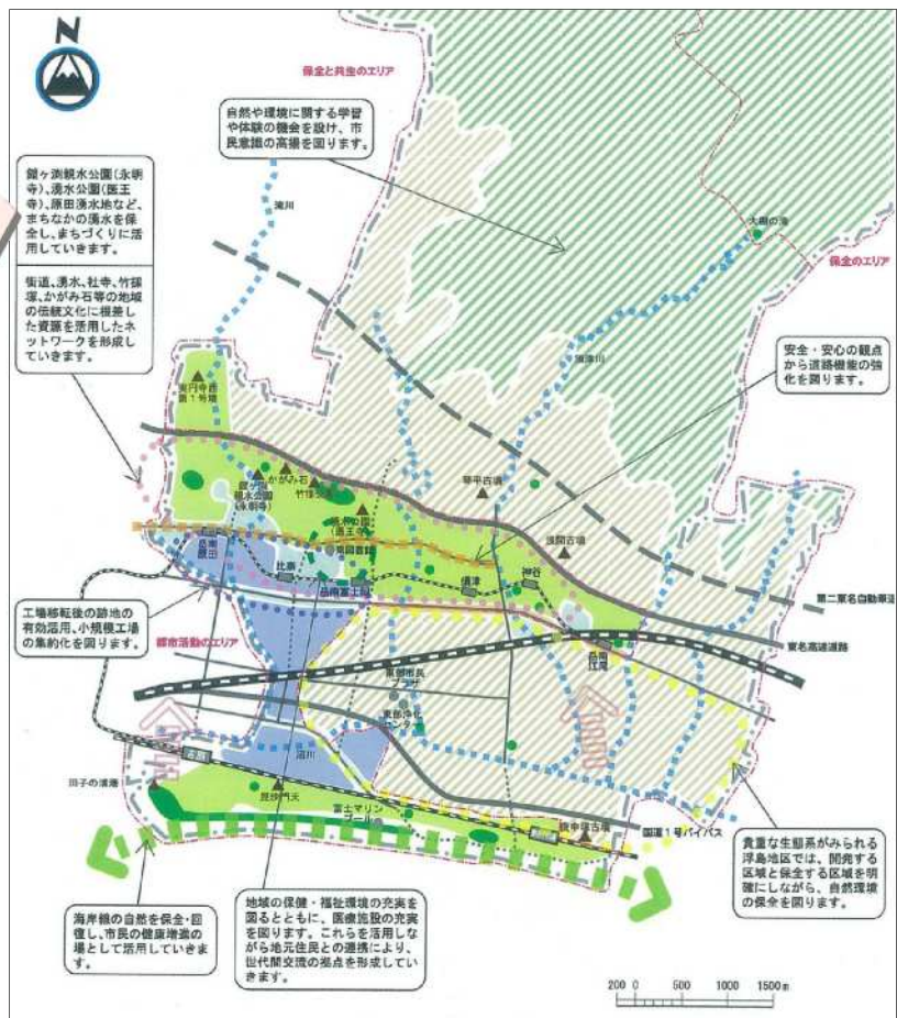
図. 富士市都市計画マスタープラン（中部及び東部ブロックまちづくり方針図）