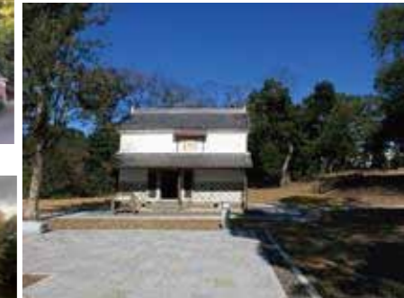
旧東泉院宝蔵 (吉原公園東側)

吉原公園には、戦国時代から明治初めまで密教寺院の富士山東泉院がありました。東泉院は、富知六所浅間神社をはじめとする5つの神社(下方五社)を管理する「別当」という職をつとめ、一色村や神戸村など6か村を支配する地域の有力な寺院でした。現在、吉原公園内には、旧所有者(六所家)から寄贈を受けた宝蔵が残っており、東泉院や六所家に関わる貴重な資料群(「六所家旧蔵資料」)が残されていました。一般公開しており、江戸幕府から東泉院の領地を認められた「朱印状」や富士山や東泉院の由緒について書かれた「富士山縁起」、江戸時代の東泉院の様子がわかる「東泉院絵図」など主に宝蔵に伝わった資料を中心にパネル展示しています。