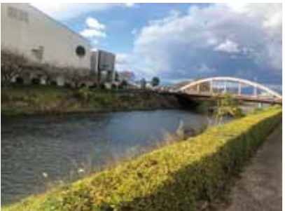
潤井川 (ロゼシアター東側) 「加島の旧東海道コース」