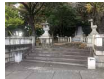
忠霊塔 (吉原高校東側)