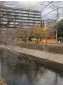
錦町公園 (小潤井川沿い)