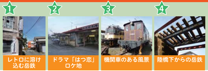
1 レトロに溶け込む岳鉄 2 ドラマ「はつ恋」ロケ地 3 機関車のある風景 4 陸橋下からの岳鉄

岳鉄沿線にはステキな散策スポットや美味しいお店、ドラマのロケ地などの魅力がいっぱいです！