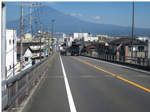
富士大橋から見た富士駅周辺地区