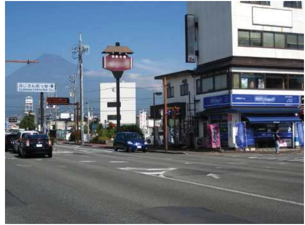
新富士駅周辺の市街地