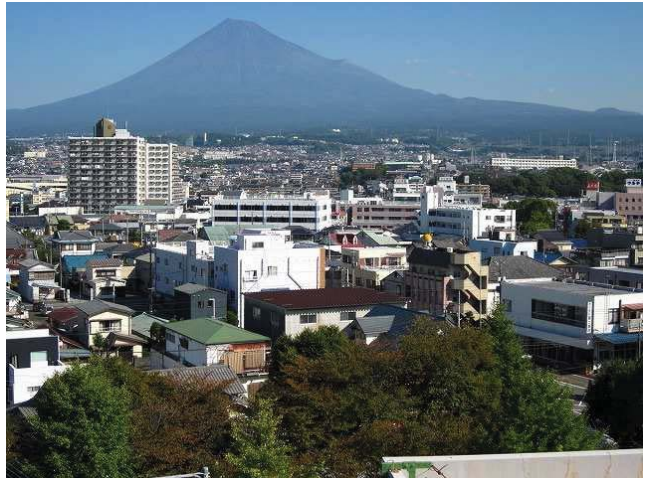
ラ・ホール富士から見た地区のまち並み