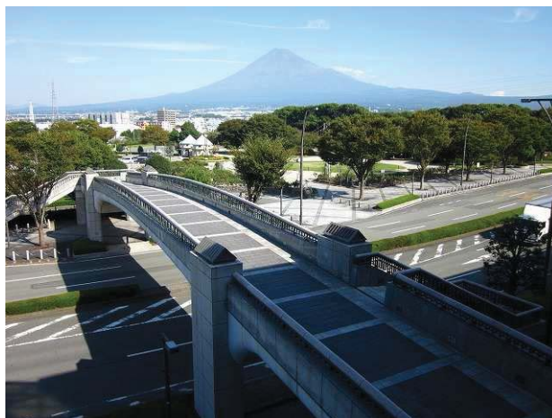
ロゼシアターから見た富士中部・市役所周辺地区