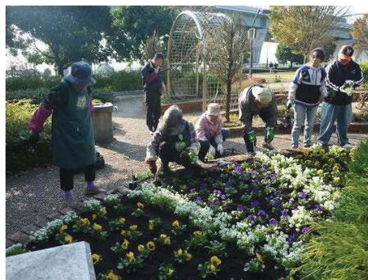
富士市花の会による花壇づくり