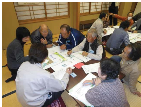
さんどまき公園のワークショップ