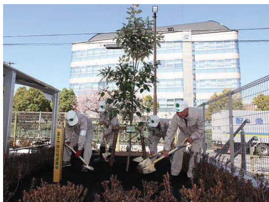
緑化指導員による植樹活動