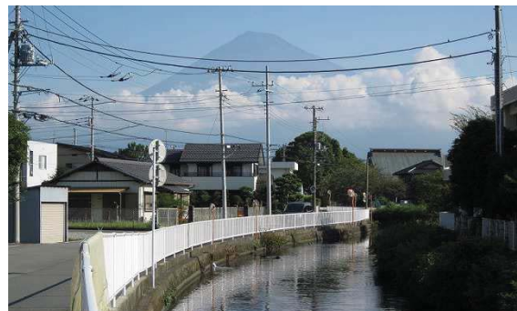
市街地の中の水辺