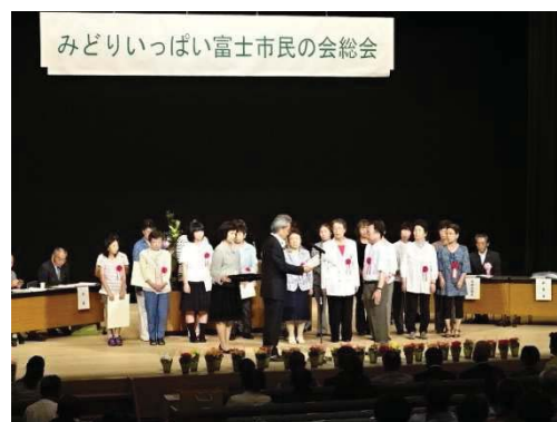
みどりいっぱい富士市民の会総会