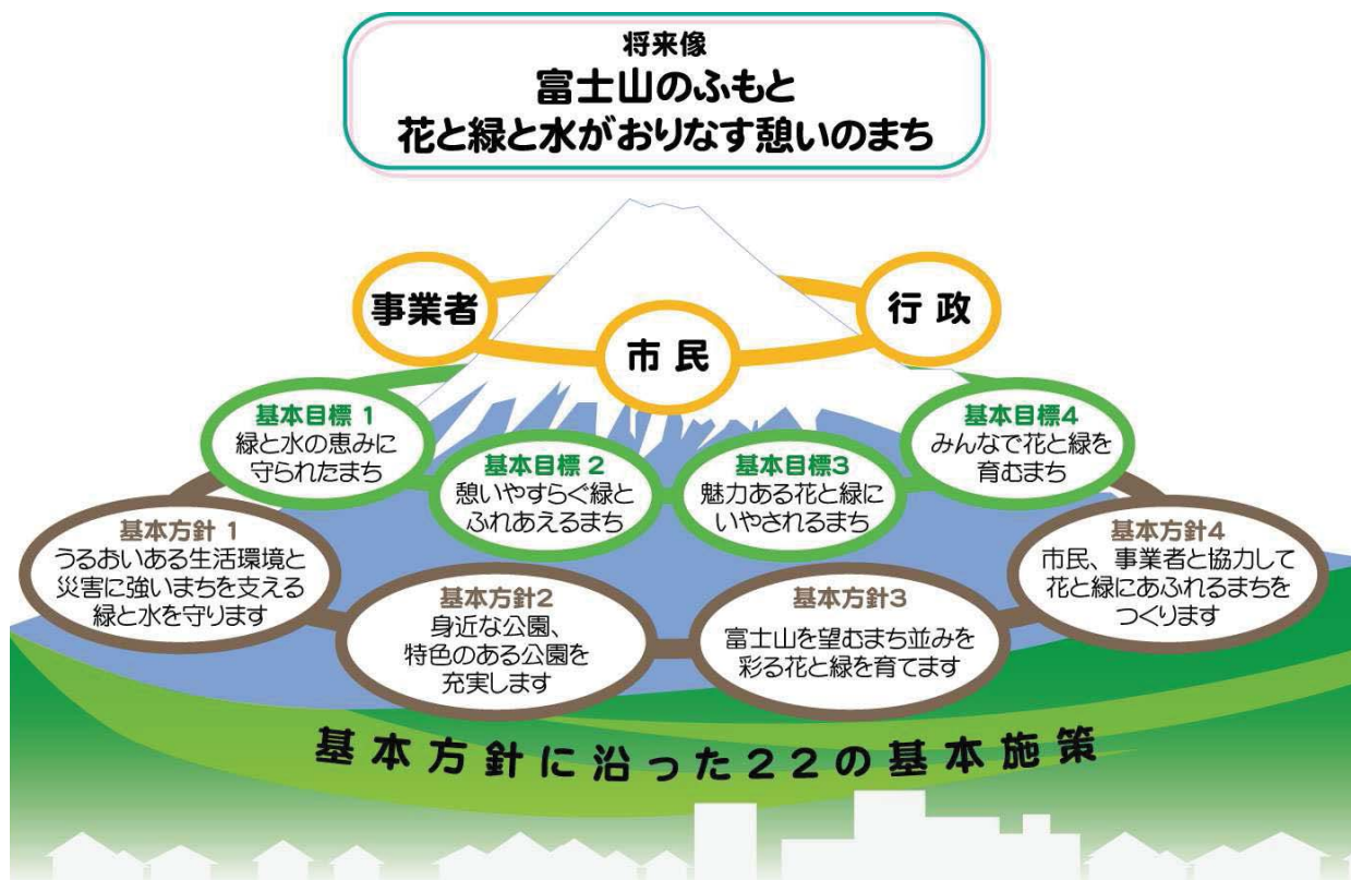
図 4.1 将来像実現のために

将来像を実現するためには、市民、事業者、行政と、ひとつひとつの基本目標、基本方針、基本施策が、本市を支える最も大切な存在「富士山」によってつながる必要があります。